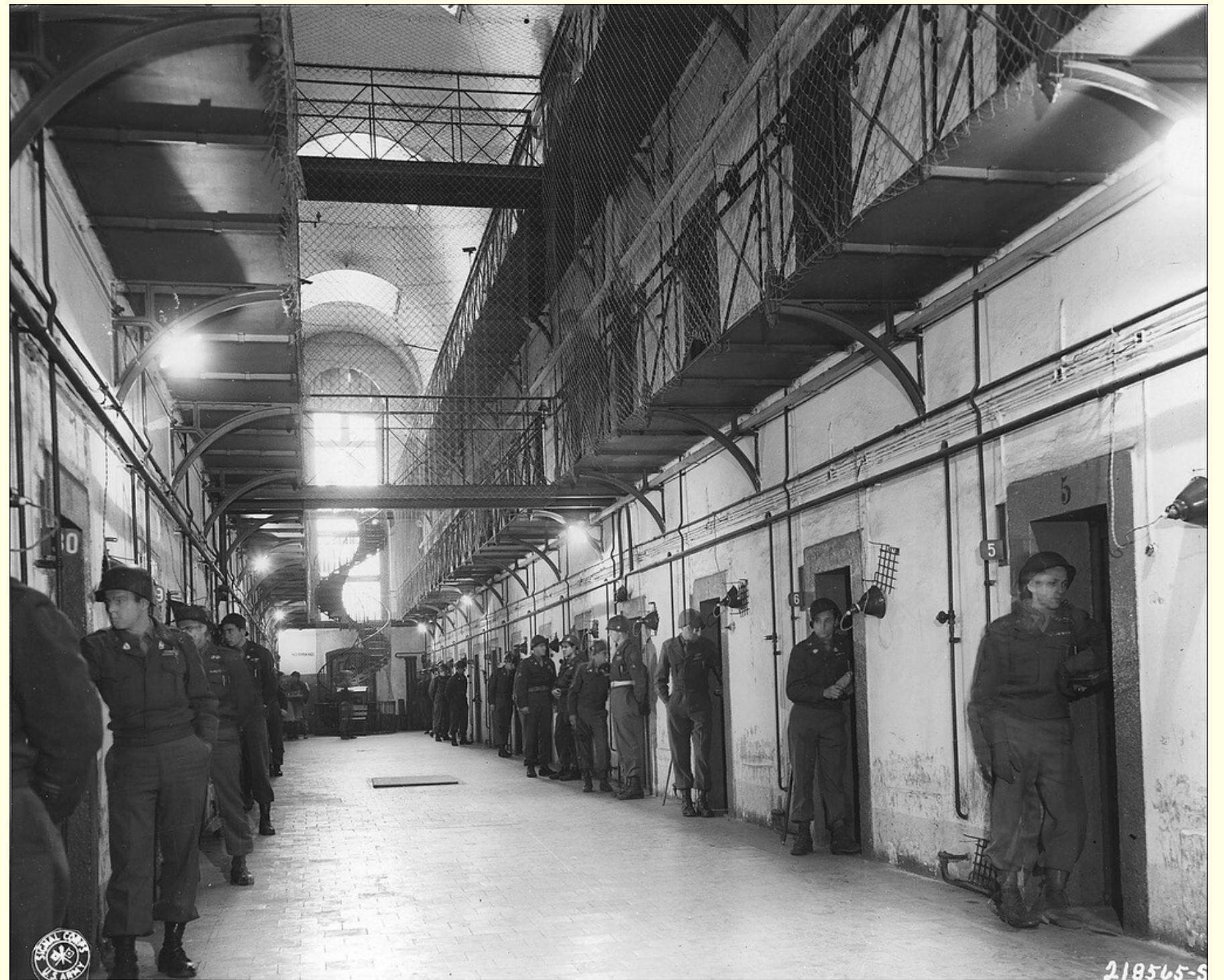
На фотографии: вид на коридор тюрьмы Нюрнберга, где содержались главные нацистские преступники, круглосуточное наблюдение за которыми вели охранявшие тюрьму американские солдаты.

РЕЗОЛЮЦИЕЙ ГЕНЕРАЛЬНОЙ АССАМБЛЕИ ООН ОТ 11 ДЕКАБРЯ 1946 ГОДА НЮРНБЕРГСКИЕ ПРИНЦИПЫ БЫЛИ ПРИЗНАНЫ В КАЧЕСТВЕ ОБЩЕПРИЗНАННЫХ НОРМ МЕЖДУНАРОДНОГО ПРАВА. ОНИ ЛЕГЛИ В ОСНОВУ НОРМ О ТЯГЧАЙШИХ МЕЖДУНАРОДНЫХ ПРЕСТУПЛЕНИЯХ, ВОЕННЫХ ПРЕСТУПЛЕНИЯХ, ГЕНОЦИДЕ, ПРЕСТУПЛЕНИЯХ ПРОТИВ ЧЕЛОВЕЧНОСТИ, КВАЛИФИКАЦИИ ИХ ПРИЗНАКОВ И СОСТАВА. В РАМКАХ ООН В 1948 ГОДУ БЫЛА ПРИНЯТА КОНВЕНЦИЯ О ПРЕДУПРЕЖДЕНИИ ПРЕСТУПЛЕНИЯ ГЕНОЦИДА И НАКАЗАНИИ ЗА НЕГО, А ТАКЖЕ В 1949 ГОДУ - ЧЕТЫРЕХ ЖЕНЕВСКИХ КОНВЕНЦИЙ О ЗАЩИТЕ ЖЕРТВ ВОЙНЫ.