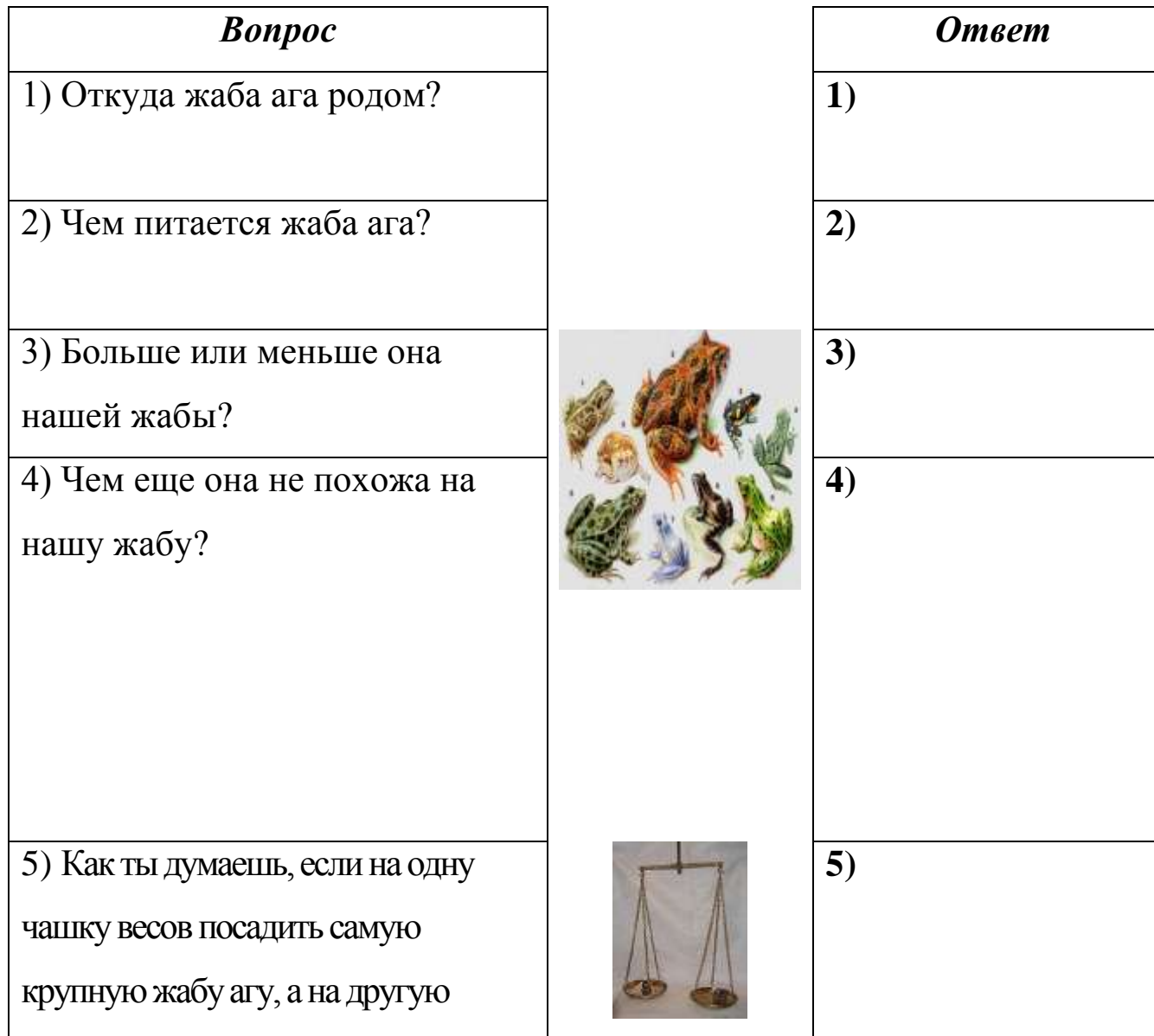
Таблица. Жаба ага

Задание 4. Перечитай текст и «расскажи» жабе аге, коротко ответив на вопросы таблицы.